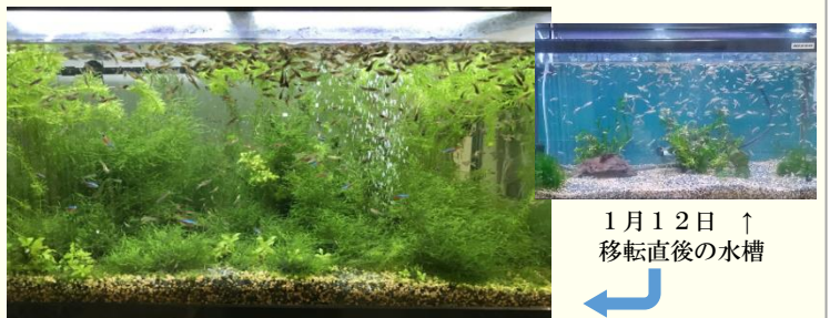
1月12日 ↑ 移転直後の水槽