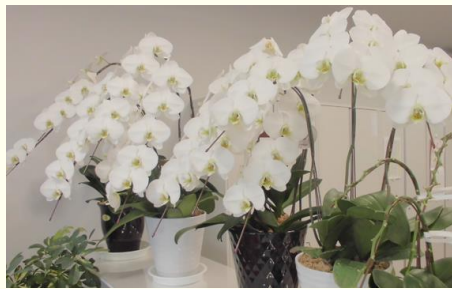
4カ月経っても花が咲いたままの胡蝶蘭

また、玄関の水槽は、本来の自然環境を表現しているかのように、緑豊かな良い状態です。